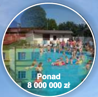
Ponad 8 000 000 zł

Urząd Miasta i Gminy ul. Kościuszki 2 58-250 Pieszyce www.pieszyce.pl um@pieszyce.pl