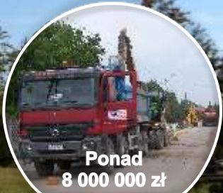
Ponad 8 000 000 zł